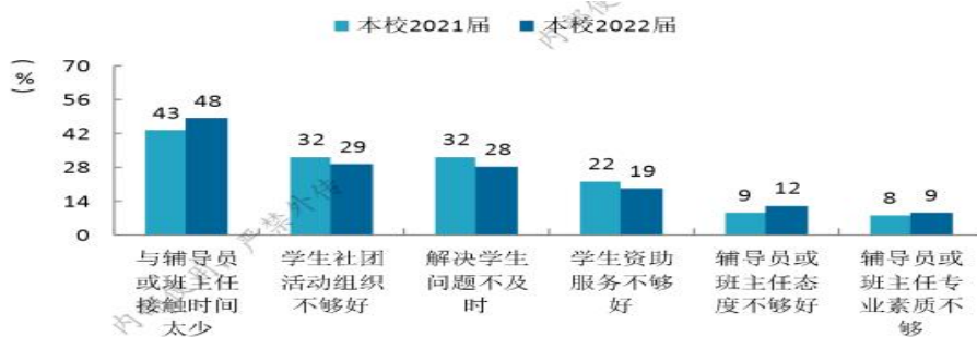
图 6 学生工作、生活服务主要改进需求

学生工作开展效果较好，2019-2022 届毕业生对学生工作的满意度（分别为 93%、93%、93%、94%）稳中有升，需要引起注意的是，学生与辅导员或班主任接触时间的改进需求仍较高（48%）。见图 6。